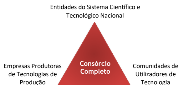
Figura 2 – Triângulo Virtuoso da Inovação Tecnológica