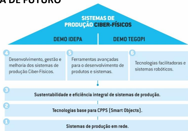
Figura 1 - Estrutura do Projeto

ASSOCIAÇÃO CCG/ZGDV, AZEVEDOS INDÚSTRIA, BRESIMAR AUTOMAÇÃO, BTL, CATIM, CEI, CENTIMFE, CITEVE, COLEP PORTUGAL, CONTROLAR, CRITICAL MANUFACTURING, CTCOR, CTCP, CTCV, CTIC, FELINO, FLOWMAT, IDEPA, INDEVE, INEGI, INESC TEC, INL, INOCAM, IPCB, IPL, IPS, IST, ISQ, JPM, MCG, MICROPROCESSADOR, MOTOFIL ROBOTICS, NEADVANCE, RIBERMOLD, SARKKIS ROBOTICS, SILAMPOS, SIRMAF, SISTRADE, SOFTI9, SONAE CENTER SERVIÇOS II, TALUS ROBOTICS, TEGOPI, UA, UC, UP, VALINOX, VANGUARDA